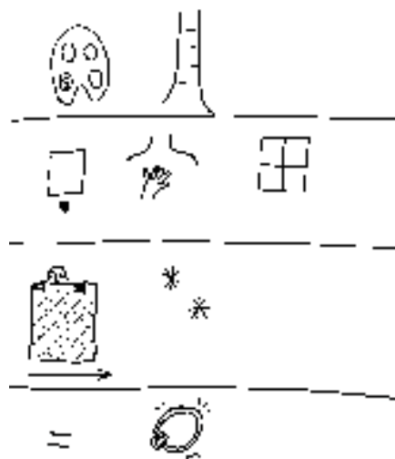
Рис. 1. Пример мнемодорожек к четверостишию стихотворения С. Есенина «Белая берёза»

Так выясняется конкретное лексическое значение каждого слова. Глагол изображается с помощью стрелки — она символизирует движение, изменение. Несмотря на то, что с помощью картинки можно изобразить только предмет, в работе над лексическим значением глагола есть необходимость в изображении предмета, совершающего действие. Каждое слово повторяется в замедленном темпе и сопровождается движением руки вверх или вниз, побуждая детей к повышению и понижению интонации.